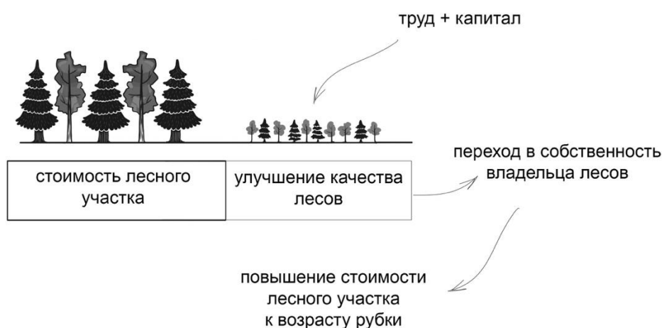
Рис. 2. Содержание лесоводственной деятельности

для любой другой экономической деятельности, зависят от нормы окупаемости, рентабельности и прибыли. Порог рентабельности определяется через окупаемость затрат на заготовление древесины и арендной платы, в случае российской лесной отрасли. Так как наиболее релевантным для эксплуатации видом экономической деятельности в лесной отрасли России — является заготовка древесины на участке, арендованном сроком до 49 лет. Итак, смоделированное содержание эксплуатационной деятельности соответствует и может осуществляться в институциональных реалиях России, учитывая отсутствие явных барьеров для такой деятельности. Другой вопрос — качество и характер данных процессов зависит от целого комплекса факторов.